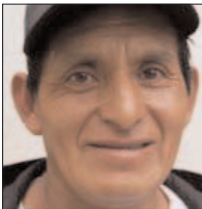
MANUEL MOROCHO VICEPRESIDENTE DE LA UCIA

indígenas en este caso para la circunscripciones territoriales indígenas, luego hemos planteado que debemos derrotar al TLC y que todas las políticas que implementa el gobierno deben estar canalizados para las comunidades.