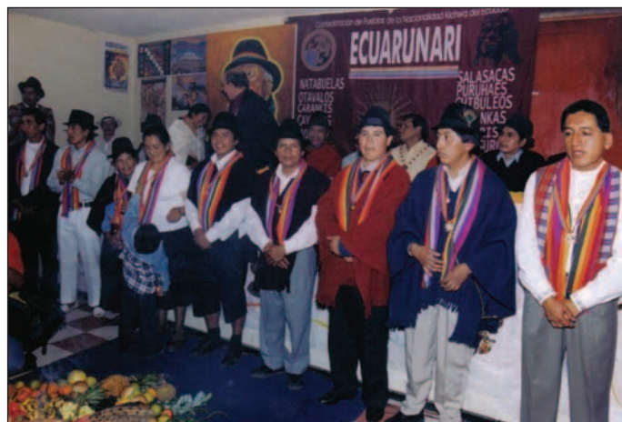
Consejo de Gobierno 2003-2006.

Dejamos constancia de nuestro reconocimiento sincero al